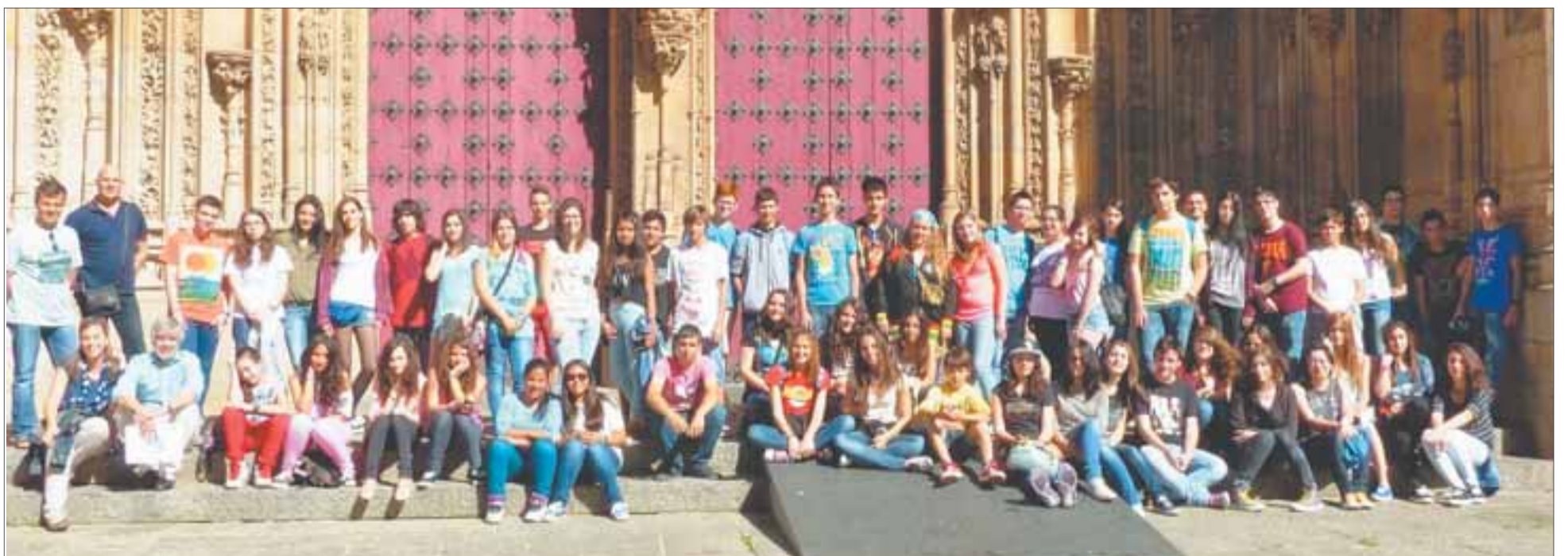
Imagen de la visita que los alumnos del Institut Torreforta realizaron la pasada semana a la localidad castellana. Hoy los alumnos salmantinos llegan a Tarragona.